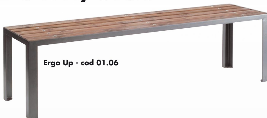
Ergo Up - cod 01.06