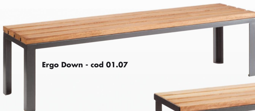
Ergo Down - cod 01.07